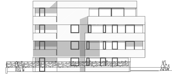
Ansicht von der Goethestraße